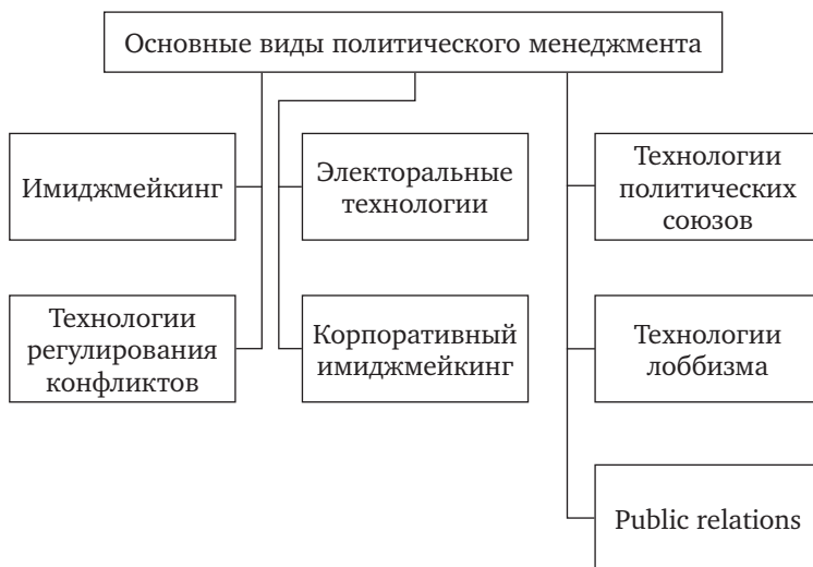
Схема 1.2. Основные виды политического менеджмента

Вместе с тем разделение политико-технологического управления на различные виды является достаточно условным. На практике одному и тому же субъекту управления нередко приходится решать различные задачи, например создавать узнаваемый, понятный населению образ политической организации и одновременно формировать имидж сильного, компетентного, заботящегося о нуждах простого человека лидера этой организации. Технологии лоббизма включают, как правило, не только поиск возможностей воздействия на лиц, принимающих государственные решения, но и формирование в глазах общественности образа группы интересов как силы, борющейся за процветание страны.