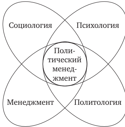
Схема 1.3. Место политико-управленческого знания в системе социальных наук

трофированное изображение политических технологий на рисунке, в жизни перечисленных научных сообществ исследования в этой области занимают незначительное место.